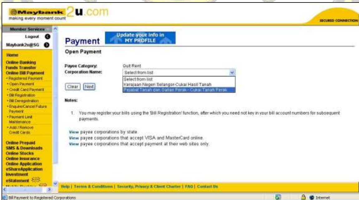
Gambarajah 3 : Skrin pilihan Corporation Name